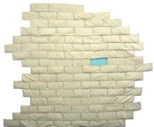
Sin titulo, IRATXE LARREA, 2006