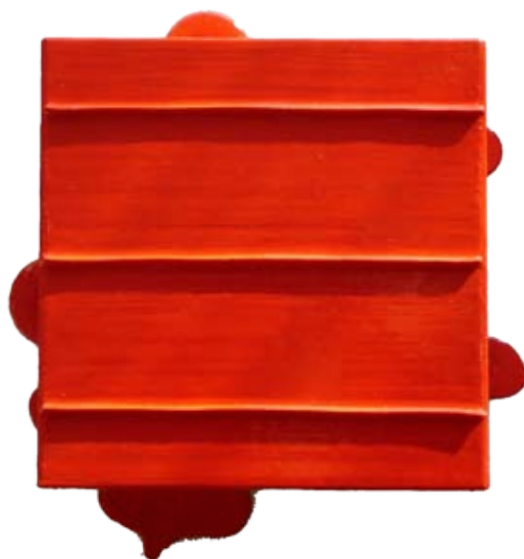
relief serie 139A. 15x15 cm